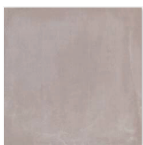
Cement:セメント マット N/CE2 アンチスリップ AS/CE2