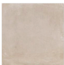
Rope:ロペ マット N/RP2 アンチスリップ AS/RP2