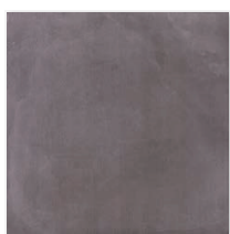
Ground:グラウンド マット N/GU2 アンチスリップ AS/GU2