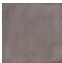
Mud:マッド マット N/MD2 アンチスリップ AS/MD2